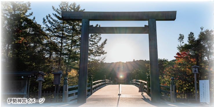
伊勢神宮イメージ