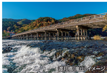
渡月橋(嵐山)イメージ