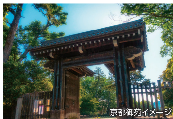
京都御苑イメージ