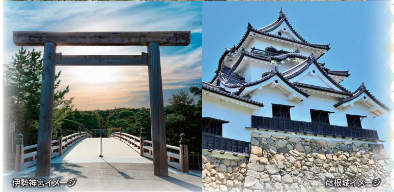
伊勢神宮イメージ