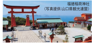
福德稲荷神社