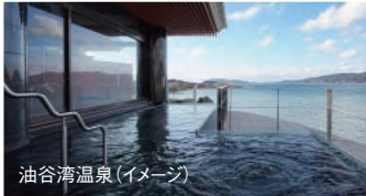
油谷湾温泉(イメージ)

油谷湾に面した、絶好のロケーション。 とろとろとしたお湯が自慢で、滑らかな肌ざわりから「美人の湯」としても知られています。海風を感じながら、心やすらぐひとときをお過ごし下さい。