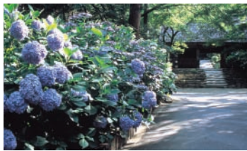
阿弥陀寺