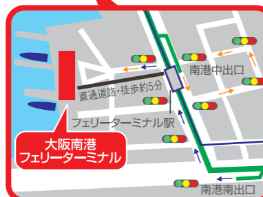
← 神戸・大阪市内方面より ← 和歌山・関空・堺方面より