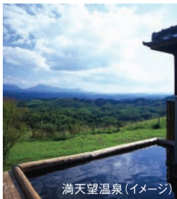
満天望温泉(イメージ)

宝泉寺温泉…自然豊かな山間に佇む温泉郷。無色透明、肌にやさしいまろやかな美人湯。