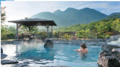
星生温泉(イメージ)

■最少催行人数:25名 ■添乗員同行※バスガイドは付きません。 ■旅行代金に含まれるもの:往復フェリー(ツーリスト(2等洋室))料金、バス代、通行料、高速代、食事代(昼食弁当1回)、しまつかフェトレイン乗車賃(島原駅→本諫早駅)、入場料(島原城)消費税等諸税 ■利用バス会社:西鉄観光バス又はタイガー、ラビットバスもしくは同等クラス ※昼食はしまつかフェトレイン車内にて弁当昼食となります。 ※号車・座席の指定はできません。