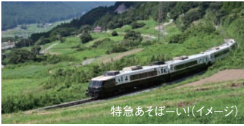
特急あそぼーい!!(イメージ)

2泊3日 船中2泊 往路 1便船17:00発 ツーリスト 復路 2便船19:50発 ツーリスト