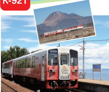
しまつかフェトレイン(イメージ)