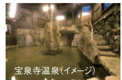
宝泉寺温泉(イメージ)

宝泉寺温泉…自然豊かな山間に佇む温泉郷。無色透明、肌にやさしいまろやかな美人湯。