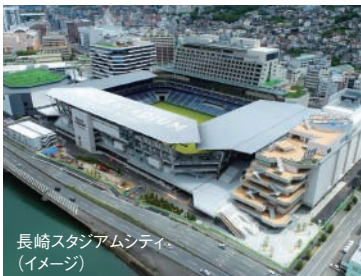
長崎スタジアムシティ (イメージ)