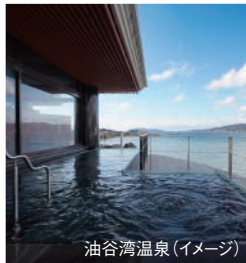
油谷湾温泉 (イメージ)