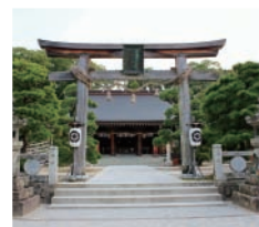
松陰神社(イメージ)