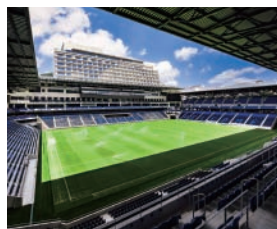
長崎スタジアムシティ (イメージ)