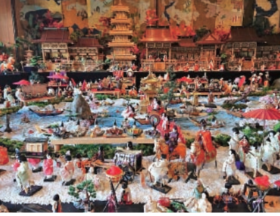
旧伊藤伝右衛門邸(イメージ)