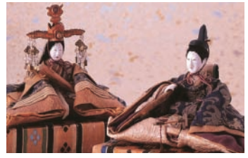
松浦史料博物館(イメージ)