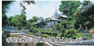
寺院と教会の見える風景(イメージ)