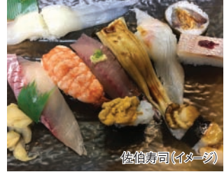
佐伯寿司(イメージ)

2泊3日 船中2泊 往路 1便船17:00発 ツーリスト 復路 2便船19:50発 ツーリスト 大分県