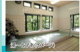
湯〜とびあ(イメージ)

●最少催行人数:18名 ●添乗員同行※バスガイドは付きません。■往復フェリー(ツーリスト(2等洋室))料金、バス代、通行料、高速代、食事代(昼食弁当1回)、入浴代、消費税等諸税 ■利用/バス会社:はちまん観光バスもしくは同等クラス(小型バスで運行) ※歩きやすい運動靴(ウォーキングシューズ又はハイキングシューズ)と服装でご参加ください。 ※入浴用タオルは各自ご用意ください。