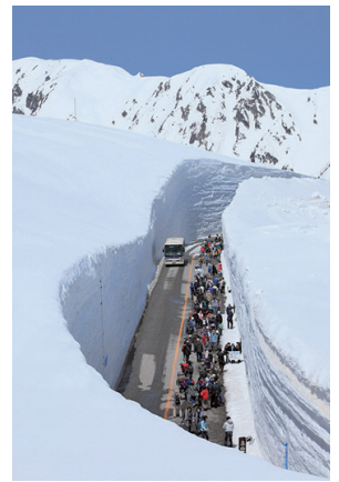
雪の大谷イメージ