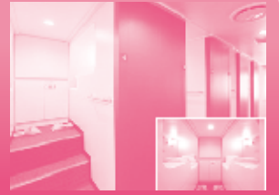
2便船ツアーリスト (イメージ)

レディースルームあり! 女性お一人旅、グループ旅行に も最適です。 ※お部屋には数に限りがございます。