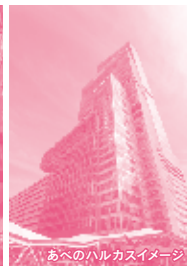
あべのハルカスイメージ